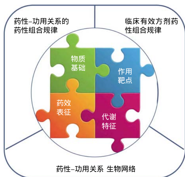
图2 基于药性组合的性效规律研究框架